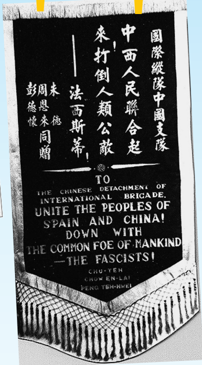
1938年中共中央托人从延安给国际纵队中的中国志愿者的锦旗,锦旗的落款是朱德、周恩来、彭德怀