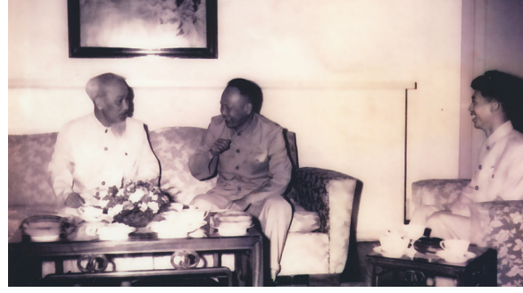
上世纪六十年代,金直夫(中)率全国工会代表团访问越南,受到越南胡志明主席(左)亲切接见

金直夫(1908—1995),字梦延,出生于青田油竹雅畹村贫苦农民之家。雅畹人多土地少,出国谋生是贫苦农民的一条重要出路。1934年,金直夫风华正茂,立志要改变贫困落后的生活,与其他乡人一样,去闯番邦,走出国谋生之