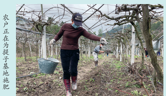
农户正在为提子基地施肥

一年之计在于春。连日来,海溪乡在紧抓疫情防控工作的同时,积极组织各个重点项目科学有序复工复产。海溪乡是我县传统的农业乡镇,提子产业作为特色产业,提子园的春耕备耕自然要跟上。