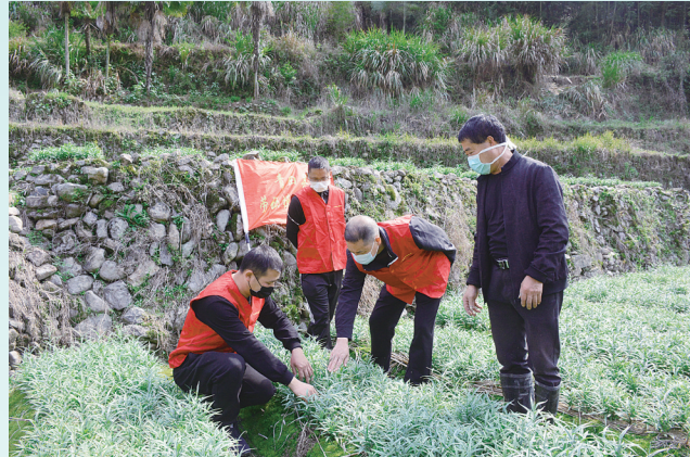
县劳模服务队成员指导种植户田间管理

“这块田里的贝母叶子成片发黄应该是得了灰霉病,发现得早,还在发病早期,喷洒点药应该问题不大。”3月24日,在巨浦乡西坑村贝母种植基地,县劳模服务队的成员一边查看浙贝母长势,一边给种植户讲解出现的问题及中后期管理的技术措施,全面提升种植户管理水平。