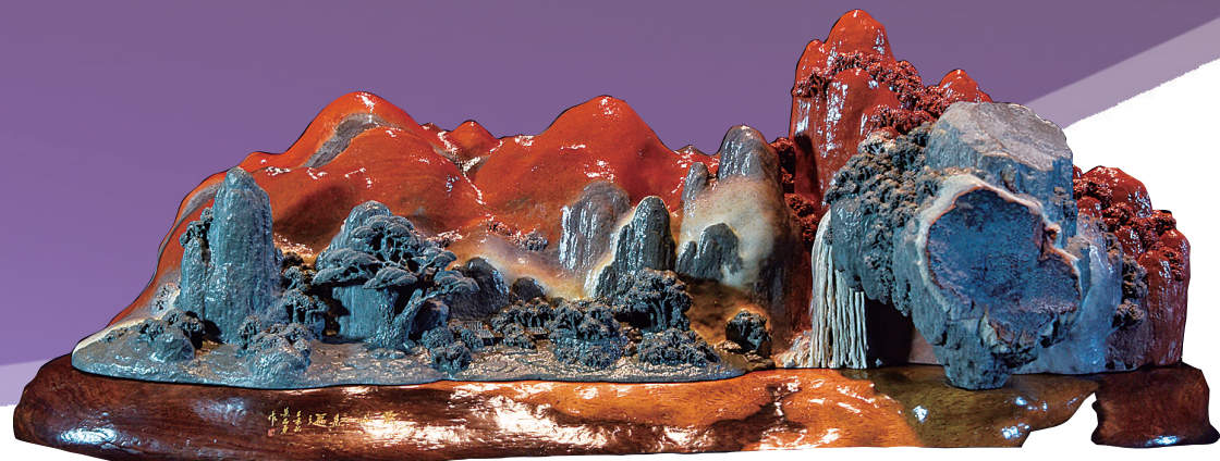
《万山红遍 层林尽染》