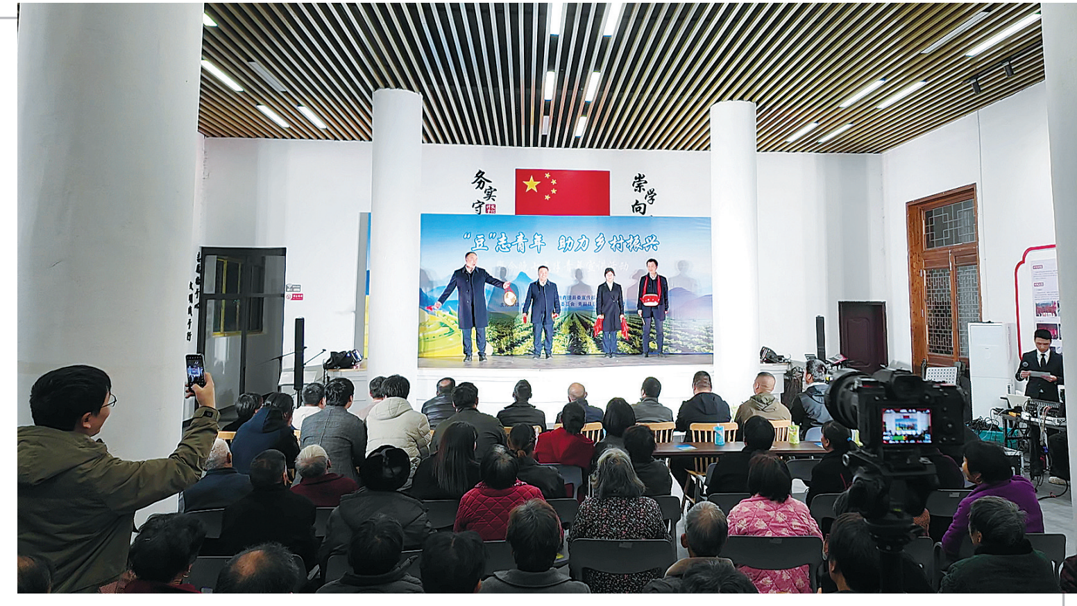
日前,“今晚七点半”宣讲活动在巨浦乡巨浦村文化礼堂热闹开演。这场活动以“‘豆’志青年,助力乡村振兴”为主题,用青春视角解读乡村发展,用乡土韵味演绎振兴故事,让乡村振兴的故事变得可听、可看、可感。

站,1个市级院士工作站,1个市级博士工作站等。 未来,青山钢铁将以此次雄鹰企业认定为契机,聚焦特种钢新材料、低碳冶金工艺、数字化工厂等重点领域,加大研发投入,推动产品向高附加值、绿色化、智能化方向升级,为浙江打造全球先进制造业基地、建设共同富裕示范区贡献更多“青山力量”。