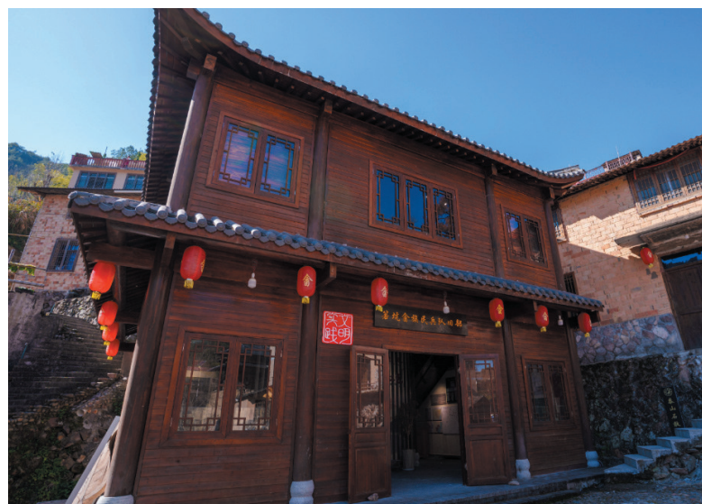
箬坑畲族民兵队旧址

自清朝顺治年间始，畲族先民携家迁徙，择此溪山定居。三百余载光阴流转，畲风渐融于青山绿水，浸于田舍瓦檐。